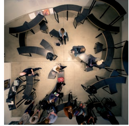
Adrian Blackwell, Furnishing Positions (Configurations 5, 2, 3) , 2014, vues d'installation | installation views, Blackwood Gallery, Mississauga.