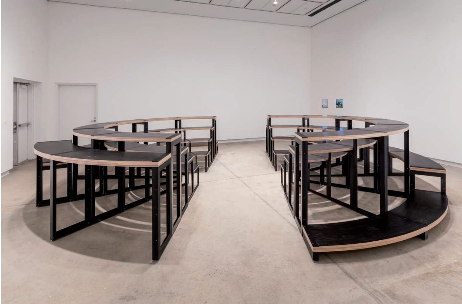
Adrian Blackwell, Furnishing Positions (Configuration 6) , 2014, vue d'installation | installation view, Blackwood Gallery, Mississauga. Photo : Toni Hafkenscheid, permission de | courtesy of the artist & Blackwood Gallery