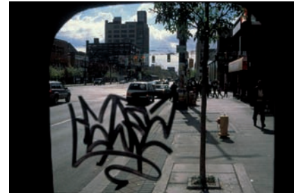
Adrian Blackwell, Circles Describing Spheres , 2014, vues d'installation | installation views, Cantor Fitzgerald Gallery, Haverford & OCAD University, Toronto.